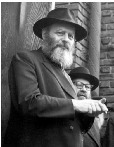
בתמונה: הרב מלווה את האורחים שנסועים מ-770 בסיומ תודש תשרי

מי שיהיה בבית הכנסת במוצאי השבת הקרובה, בוודאי ישמע את ההכרזה המיוחדת הזו – "ויעקב הלך לדרכו", אותה מכריזים בבתי כנסת חב"ד במוצאי שמחת תורה או שבת בראשית. האם שאלתם את עצמכם מה תוכן ההכרזה הזו? מה פתאום מדברים על יעקב כאשר אנו רק מתחילים את פרשת בראשית?